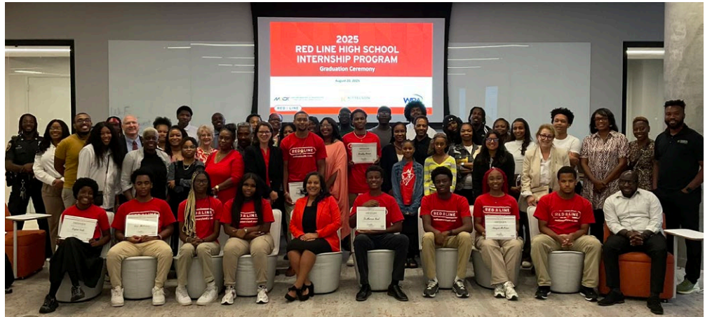
Participantes del programa de prácticas de Red Line 2025, personal de la MTA y exalumnos del programa que participaron hace más de 15 años.

Este verano, los pasantes de Red Line participaron en seis valiosas semanas de aprendizaje, creación y exploración del sistema de transporte público de Baltimore. El programa de prácticas de Red Line para estudiantes de escuela secundaria (high school) incluyó a estudiantes de Edmondson-Westside, Patterson y Woodlawn