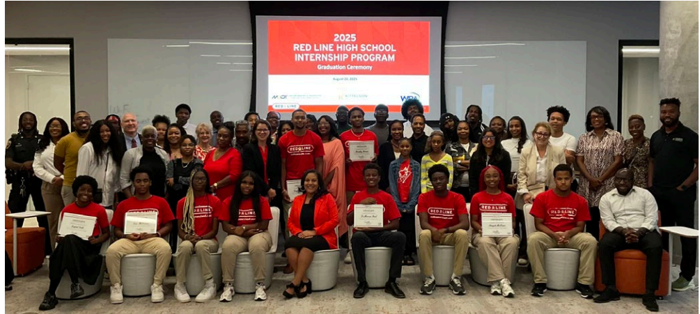
Participantes del programa de prácticas de Red Line 2025, personal de la MTA y exalumnos del programa que participaron hace más de 15 años.

Este verano, los pasantes de Red Line participaron en seis valiosas semanas de aprendizaje, creación y exploración del sistema de transporte público de Baltimore. El programa de prácticas de Red Line para estudiantes de escuela secundaria (high school) incluyó a estudiantes de Edmondson-Westside, Patterson y Woodlawn