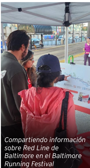
Compartiendo información sobre Red Line de Baltimore en el Baltimore Running Festival

Gracias por su activa participación a lo largo de este año. ¡Esté pendiente de novedades para 2025!