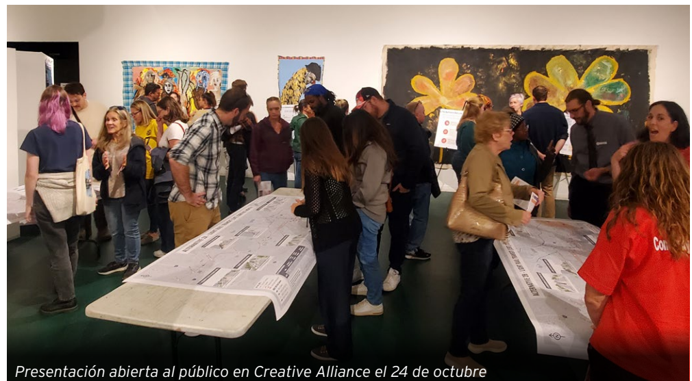
Presentación abierta al público en Creative Alliance el 24 de octubre